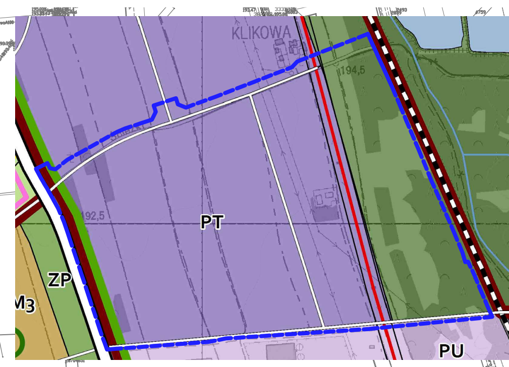
WYRYS ZE ZMIANY STUDIUM UWARUNKOWAŃ I KIERUNKÓW ZAGOSPODAROWANIA PRZESTRZENNEGO GMINY MIASTA TARNOWA