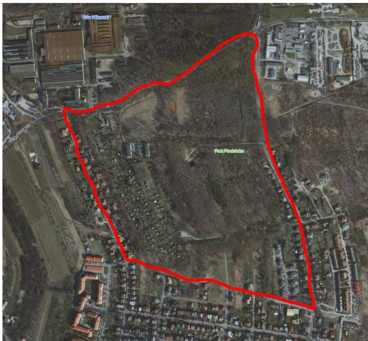
Rys. 2 - Obszar opracowania