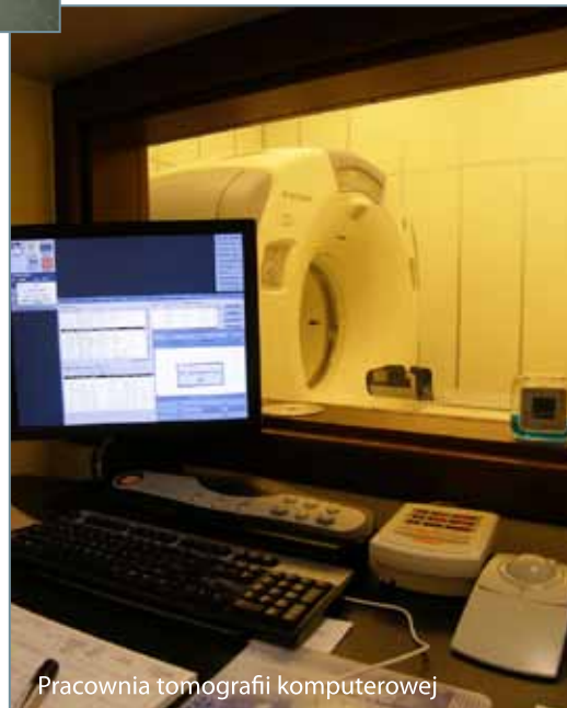
Pracownia tomografii komputerowej

Ucyfrowienie pracowni RTG to kolejny etap informatyzacji szpitala, który