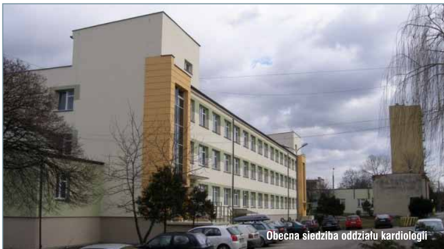
Obecna siedziba oddziału kardiologii

Władze miasta i Szpital Szczeklika podjęły działania, które w ciągu kilku lat doprowadzą do powstania Centrum Usług Kardiologicznych. By możliwe było jego uruchomienie, konieczne będzie jednak wybudowanie nowego gmachu. Budynek ułatwi pracę lekarzom i zwiększy komfort leczenia pacjentom. Swoje miejsce znajdą tam przeniesione ze starszych budynków