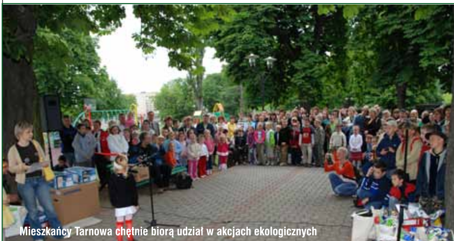
Mieszkańcy Tarnowa chętnie biorą udział w akcjach ekologicznych

Na wiele z tych zadań staramy się uzyskać dotację z Wojewódzkiego Funduszu Ochrony Środowiska i Gospodarki Wodnej w Krakowie, pozyskujemy też dodatkowe środki i nagrody rzeczowe dzięki przychylności tarnowskich firm – sponsorów przedsięwzięć proekologicznych. Zadania związane z edukacją ekologiczną zostały uwzględnione w przyjętym przez Radę Miejską „Programie Ochrony Środowiska m. Tarnowa na lata 2009-2016”. Szczegółowy plan edukacji ekologicznej znajduje się na stronie www.tarnow.pl – powinien on ułatwić wszystkim zainteresowanym wybranie najbardziej odpowiedniej formy działania i włączenie się w pracę na rzecz środowiska.