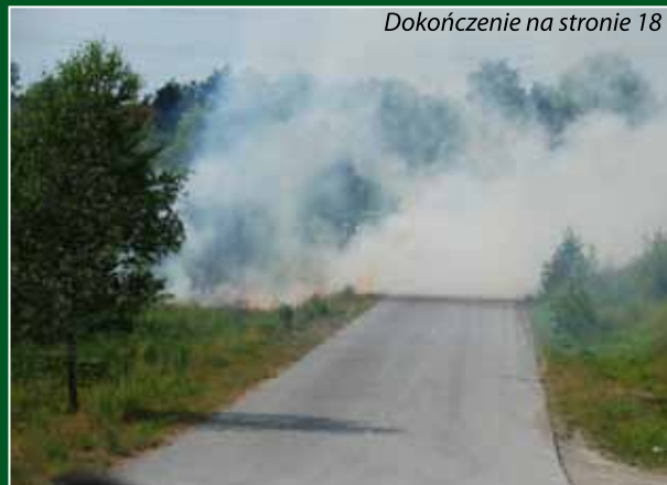
Dokończenie na stronie 18

iż z dymem powstającym podczas pożaru do atmosfery przedostają się duże ilości