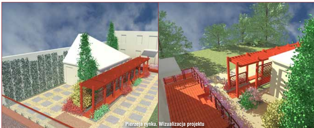
Pierzeja rynku. Wizualizacja projektu

rewitalizacji murów miejskich w czwartym kwartale tego roku.