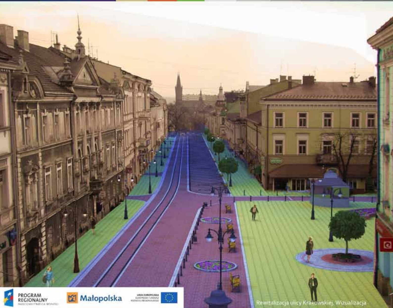
Rewitalizacja ulicy Krakowskiej. Wizualizacja