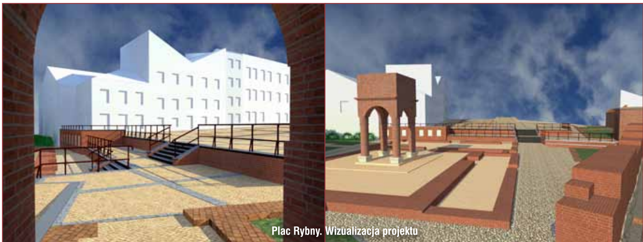
Plac Rybny. Wizualizacja projektu

Dodatkowo, w centrum miasta opracowana i wykonana zostanie również ścieżka edukacyjno-historyczna. Po wyznaczeniu i oznakowaniu szlaku turystycznego w jego przebiegu pojawią się 32 mosiężne płyty informacyjne o wymiarach 50x50 cm. Montowane w nawierzchni chodników płyty ułatwią zwiedzanie murów miejskich. Zadanie realizowane będzie po zakończeniu