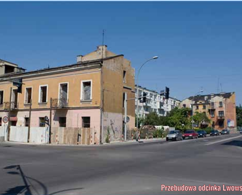
Przebudowa odcinka Lwowska-Starodąbrowska-Mickiewicza

Nowoczesne rozwiązania komunikacyjne oraz poprawa stanu dróg i ulic są priorytetem