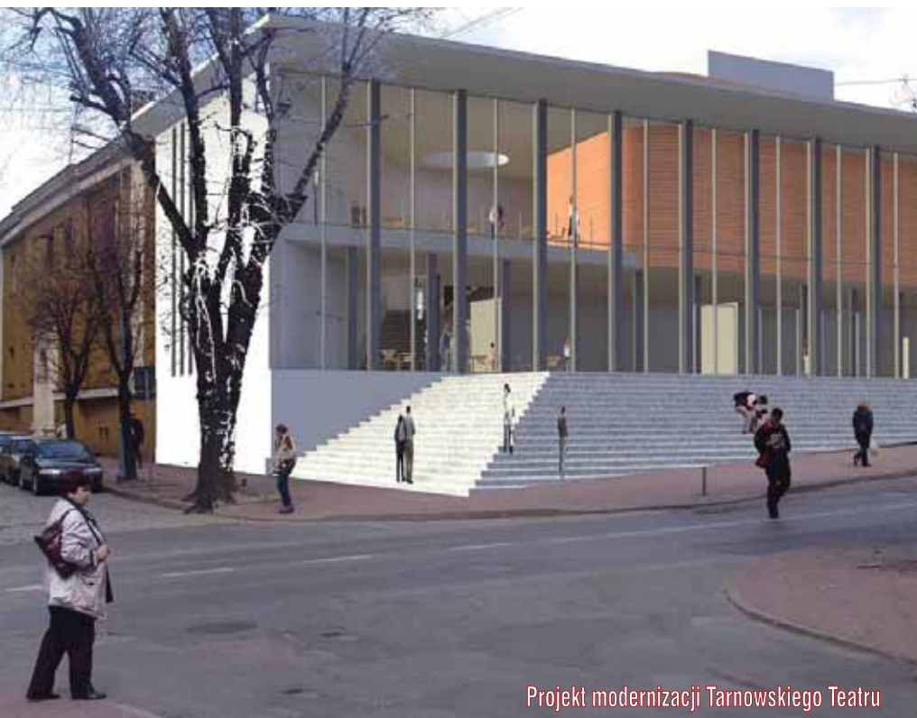
Projekt modernizacji Tarnowskiego Teatru

teatru łatwiej będzie się dostać osobom niepełnosprawnym. Na modernizację teatru dostaliśmy ponad 7 mln zł z funduszy europejskich.