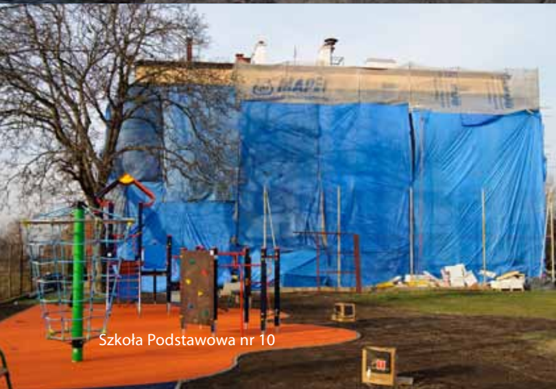
Szkoła Podstawowa nr 10