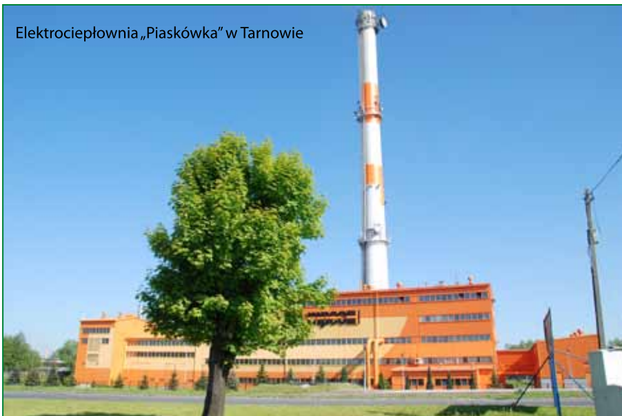
Elektrociepłownia „Piaskówka” w Tarnowie

Nad planem budowy instalacji termicznego przekształcania odpadów w naszym mieście od dwóch lat pracuje Miejskie Przedsiębiorstwo Energetyki Ciepłej w Tarnowie. W zorganizowanych przez MPEC w dniach 8 - 10 listopada br. konsultacjach społecznych dla mieszkańców Tarnowa zaprezentowano koncepcję wykorzystania potencjału energetycznego odpadów komunalnych w miejskim systemie ciepłowniczym i ewentualne lokalizacje instalacji ich termicznego przekształcania. Dwa pierwsze spotkania dedykowane były mieszkańcom dzielnic: Chyszów, Krzyż i Piaskówka, gdzie rozważana jest budowa spalarni. Jak wynika z opracowanej przez firmę konsultingową Socotec Polska analizie gospodarki odpadami w regionie tarnowskim z wkomponowanym modułem termicznego przekształcania odpadów budowa takiej instalacji w Tarnowie możliwa