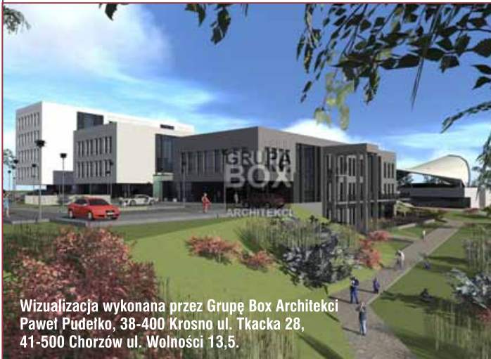
Wizualizacja wykonana przez Grupę Box Architekci Paweł Pudełko, 38-400 Krosno ul. Tkacka 28, 41-500 Chorzów ul. Wolności 13,5.

Sygnatariuszami umowy podpisanej w tarnowskim magistracie w obecności skarbnika miasta są Azoty Tarnów S.A., Państwowa Wyższa Szkoła Zawodowa, Tarnowski Klaster Przemysłowy, Stowarzyszenie Miasta w Internecie, Klaster Medycyna Polska oraz spółka partnerska „Adwokaci”.