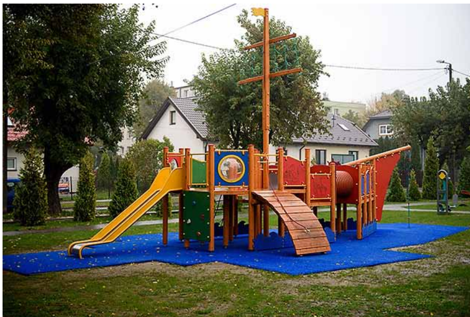
Międzypokoleniowy mini-park rekreacyjny „Od przedszkola do seniora” przy Przedszkolu nr 29 wykonany w ramach Budżetu Obywatelskiego