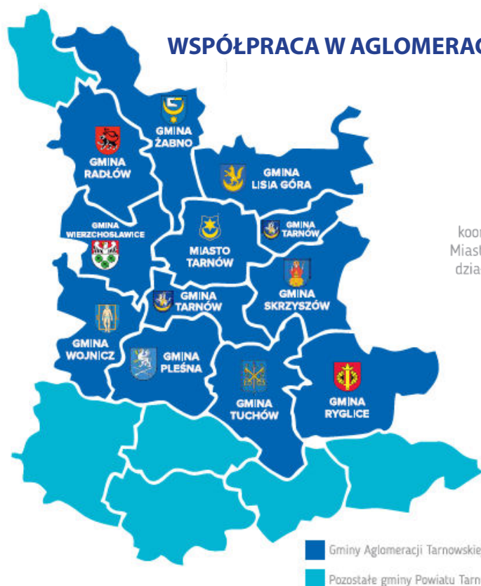
■ Gminy Aglomeracji Tarnowskiej ■ Pozostałe gminy Powiatu Tarnobrzegskiego